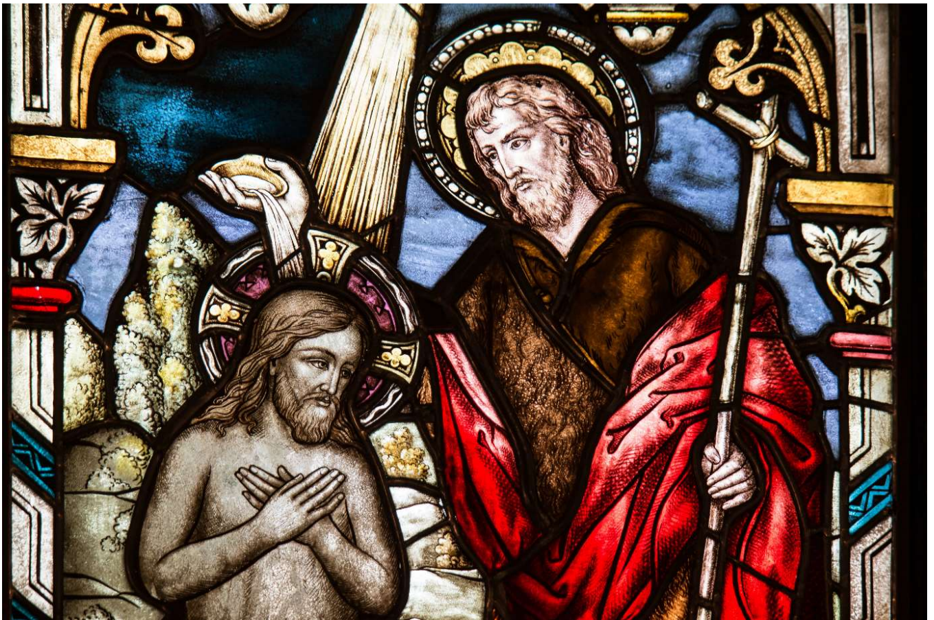
Buntes Kirchenfenster zeigt Taufszene mit Jesus und Johannes

Am 24. Juni feiern wir das Geburtsfest Johannes des Täufer. Man bezeichnet ihn gerne als den „Vorläufer“, weil er die Welt auf Christi Kommen vorbereitet. Aber Johannes ist viel mehr: Er ist der, der uns immer neu auf Jesus hinweist. Es geht nicht um uns. Auch wir stehen im Dienst Jesu, der größer ist als wir. Er muss wachsen, und wir müssen geringer werden. Das lehrt uns Johannes, und es ist gut, wenn wir uns immer wieder daran erinnern.