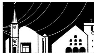
Kirche St. Michael; Kölner Str. 37, WK Kirche St. Apollinaris, Grunewald 23, WK