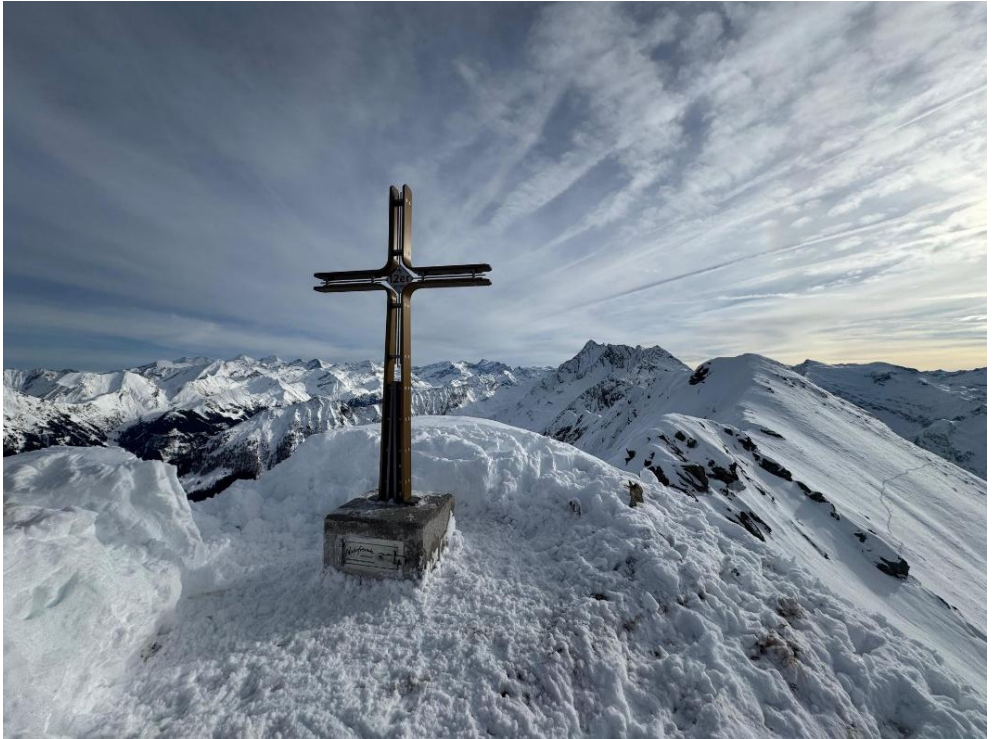
Neues Gipfelkreuz am 12er, aufgestellt 30.11.2025

Ich glaube an Gott, den Vater, den Allmächtigen, den Schöpfer des Himmels und der Erde, ...