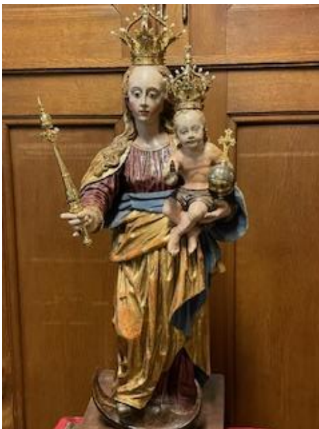
Statue vun der Tréischterin am Leed aus der Kathedral

09:30 Kathedral: Pontifikalmass mat Priesterwei fir de Cédric Latz, Diakon an der Par „Lëtzebuerg Notre-Dame“. 11:30 Biissen: Daffeier fir Pit Bettendorff-Clement. 14:30 Bruch/Parzenter: Kannerkatechees (CATE-1). 14:30 Bruch/Parzenter: Jugendkatechees (CATE-4).