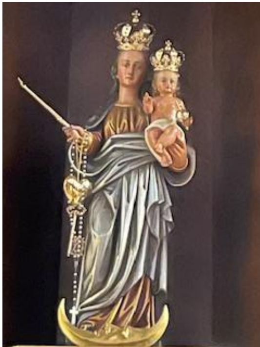
Statue vun der Tréischterin am Leed aus der Biisser Kierchl