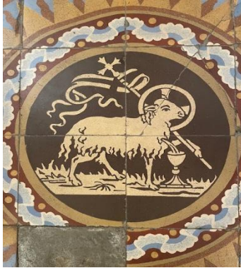
Ouschterlammotiv um Buedem vun der Äischer Kierch