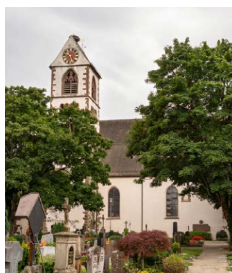
KIRCHZARTEN St. Gallus