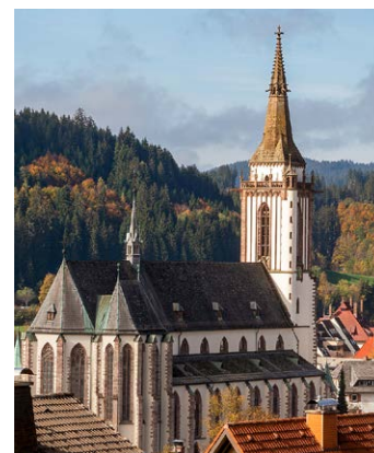
NEUSTADT Münster St. Jakobus

Samstag 18:30 Eucharistiefeier im Wechsel mit Sonntag 10:30 Eucharistiefeier