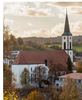
LÖFFINGEN St. Michael

8:30 Eucharistiefeier 11:00 Eucharistiefeier