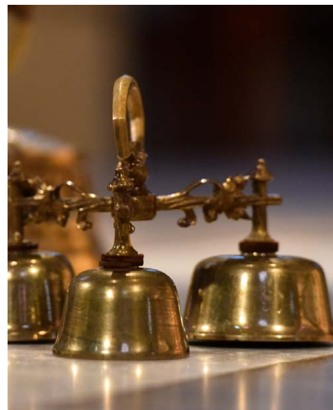
Mit den Altarschellen wird auf den Höhepunkt der Feier aufmerksam gemacht: die Wandlung.