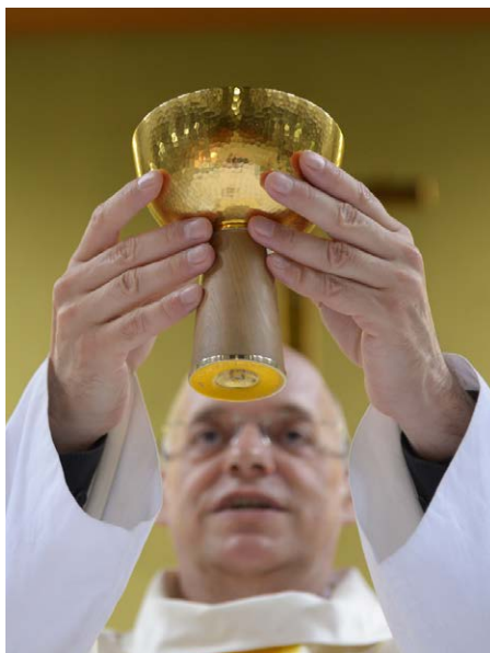
Zur Wandlung hebt der Priester die Hostie und den Kelch mit Wein hoch.