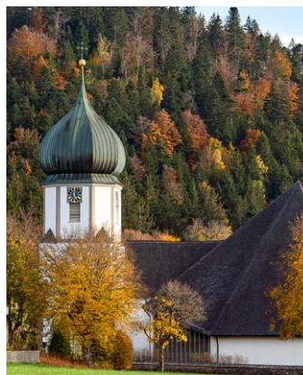
HINTERZARTEN Mariä Himmelfahrt

Samstag 18:30 Eucharistiefeier im Wechsel mit Sonntag 10:30 Eucharistiefeier