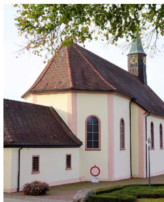
LINDBERG Mariä Himmelfahrt

8:30 Eucharistiefeier 11:00 Eucharistiefeier