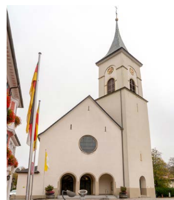
LENZKIRCH St. Nikolaus