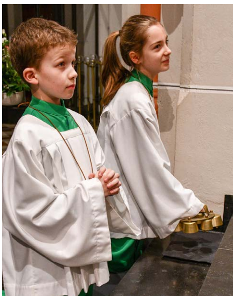
Der hörbare Auftritt der Ministranten: Sie klingeln zur Wandlung mit den Altarschellen.

IN DER KARWOCHE VERSCHWINDEN DIE ALTARSCHELLEN FÜR EINE KURZE ZEIT AUS DER LITURGIE. So wie auch die Kirchenglocken in dieser Zeit verstummen, in der des Leidens und des Todes Jesu gedacht wird, verstummen auch die Altarschellen. Dann ist die Zeit der hölzernen Ratschen und Klappern. Sie ersetzen mit ihrem dumpfen Klang in der Karfreitagsliturgie die Altarschellen. In manchen Orten gibt es auch das Karfreitagsratschen. Dann ziehen üblicherweise Jugendliche mit Holzklappern und Holzratschen durch die Straßen, um die Gläubigen an die Gebetszeiten und Gottesdienste zu erinnern.