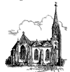
St. Martin Schiffweiler