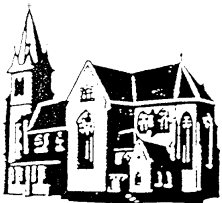
Herz Jesu Landsweiler-Reden