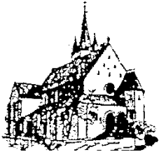
St. Barbara Stennweiler