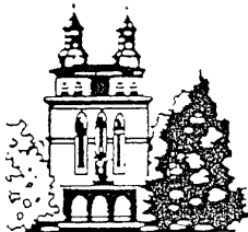
St. Laurentius Heiligenwald