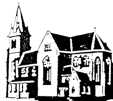
Herz Jesu Landsweiler-Reden