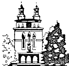
St. Laurentius Heiligenwald