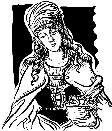
ELISABETH VON THÜRINGEN