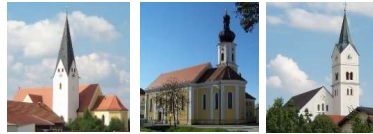
Agidienkirche, Braunschweig, Foto: Peter Kane