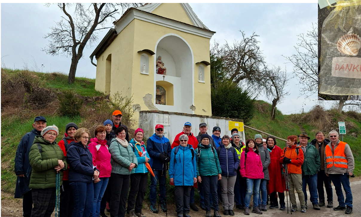
Die Pilgergruppe vor dem Neusiedler Kreuz