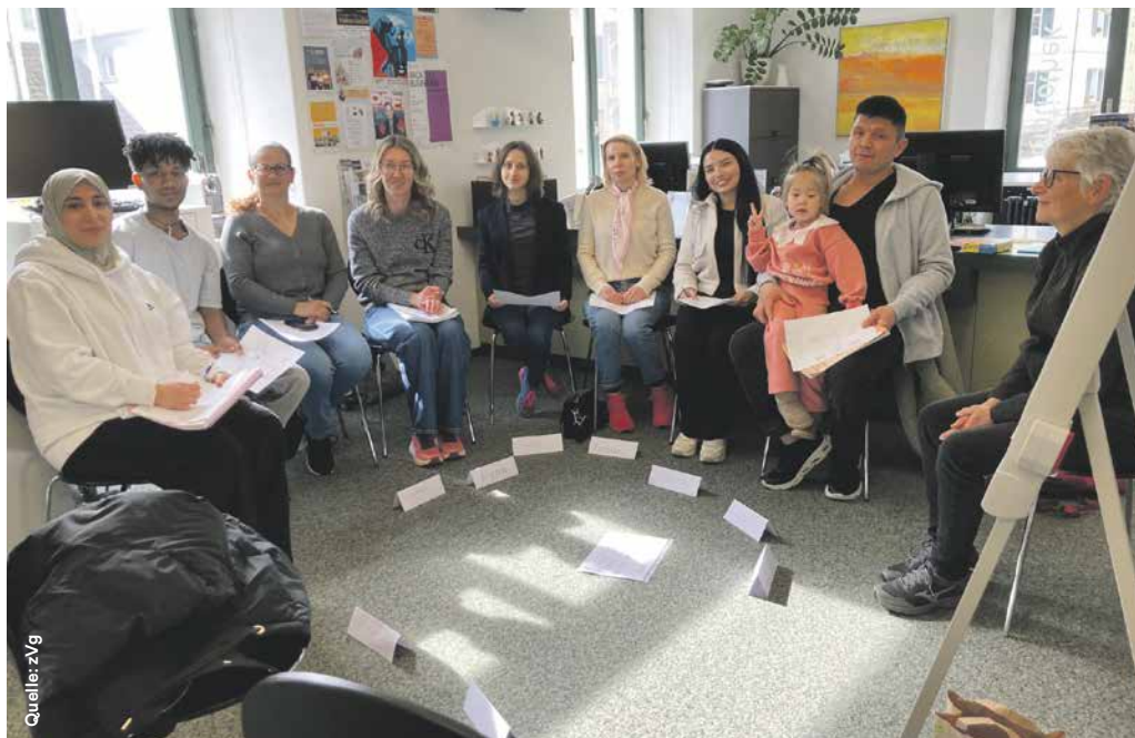
Im Deutschkurs lernen die Geflüchteten, sich in Alltagssituationen zu verständigen.