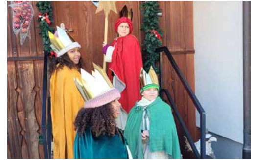
Die Sternsinger aus Mumpf