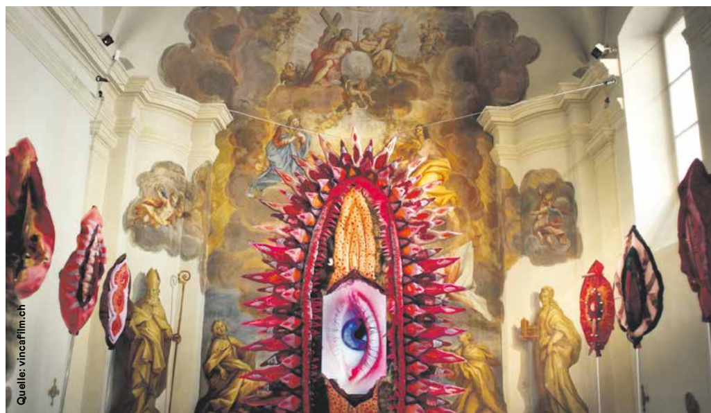
Die Installation «Monstramus – wir zeigen» der Künstlerin Ina Loitzel in der Burgkapelle des Museums Moderner Kunst. Filmbild aus «Girls and Gods».

CE: Ich bin nicht fundamentalistisch unterwegs. Ich lese die Bibel nicht wörtlich. Ich versuche, in der Bibel die Botschaften der Liebe zu finden. Ich habe oft nicht geschwiegen, gerade wenn es um das Wohl der Frauen