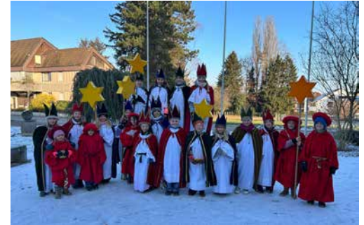
Die Sternsinger aus Wallbach