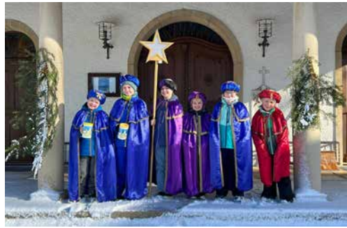
Die Sternsinger aus Schupfart

Ein kurzes Tuscheln und ein letztes Zurechtrücken der Krone bevor die Haustüre aufging. Nervös warteten die Sternsinger, bis die Tür sich öffnete und sie ihren eingeübten Segenspruch und ihr Lied vortragen durften. Die Freude über die Sternsinger Aktion war auf beiden Seiten der Tür spürbar. Nach dem der Segen auch über der Tür angebracht war und die Spende in ihrem Kässeli lag, bedankten sich die Kinder und machten sich auf zum nächsten Haus.