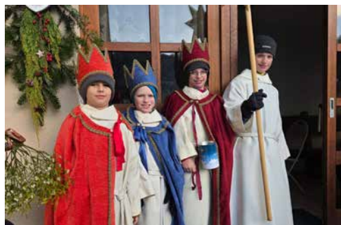
Die Sternsinger aus Obermumpf