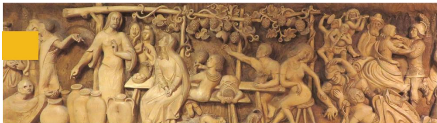
Wandrelief Pfarrsaal Wöschbach von B. Rumhold