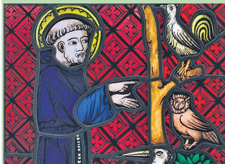
Franziskusfenster in Königsfelden (Sonnengesang)

Heiliger Vater, sei gegrüsst, der du das Licht der Heimat bist, du Form der Mindern Brüder dein und Spiegel aller Tugend rein. Du hast gezeigt den rechten Pfad durch deiner Regel weisen Rat. Fähr uns von hier, wo wir verbannt, zu dir ins himmlisch Vaterland. Gott, von dem alles Gut her rührt, dem Wort, das uns zum Vater führt, dem Hauch, der uns zur Lieb entzündet, Lob, Ehr und Danke gesungen. Amen.