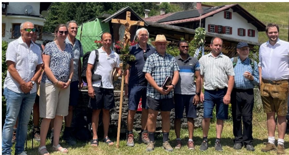
Die Vertreter aus Holzgau und Oberstdorf freuen sich am Oberstdorfer Platz über die gelungene Jubiläumswallfahrt.