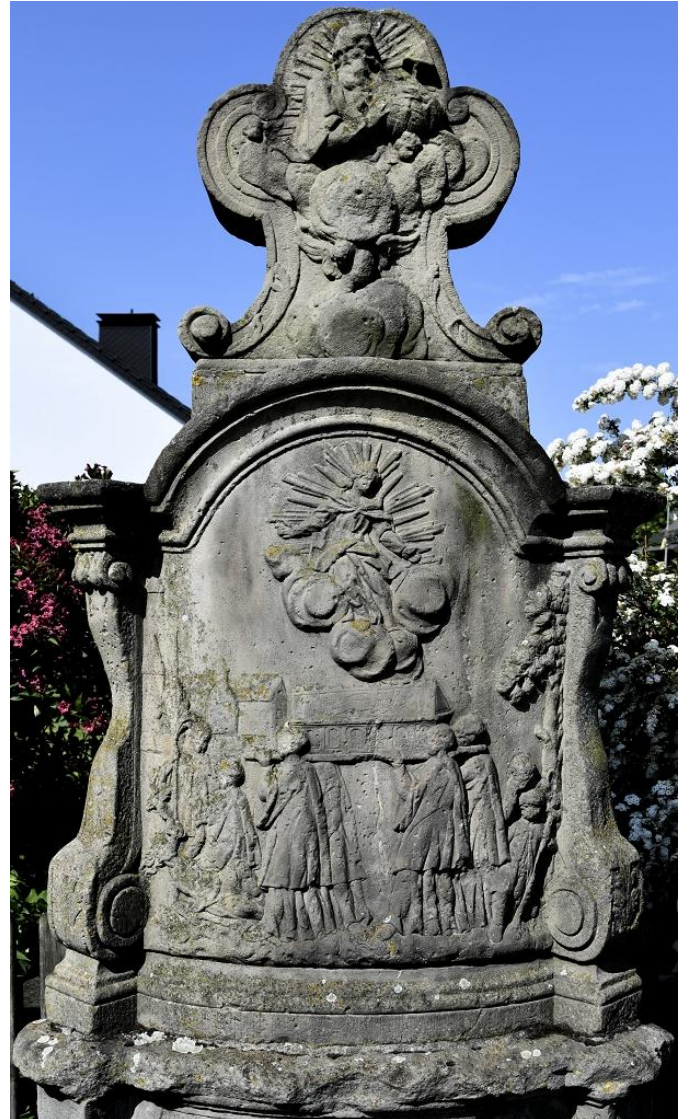
Liboristein Benhausen; Foto Bernhard Bauer

„Ich bin der Weg und die Wahrheit und das Leben.“