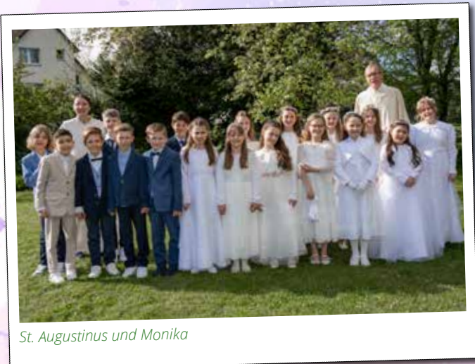
St. Augustinus und Monika

An alle Kommunionkinder unserer Pfarrei!