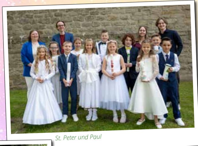
St. Peter und Paul