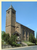
St. Bartholomäus Boos