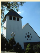
St. Dionysius Bermel