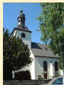
St. Kastor Weiler