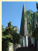
St. Stephanus Nachtsheim