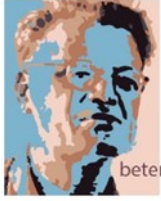
Pfarrei Alfred Delp Südliches Ried

Die Kath. Kirchengemeinde Alfred Delp Südliches Ried besteht seit ihrer Neugründung am 01.01.2025. Aus den ehemaligen elf katholischen Pfarreien des Pastoralraums Südliches Ried wurde eine neue Großpfarrei. Das Seelsorgegebiet umfasst 17.000 Christen (Stand 31.12.2025). Wir haben neun Kirchen und sind Träger der Kita Spatzennest in Bürstadt und der Kita Pater Delp in Lampertheim. Die pastoralen Mitarbeiter betreuen die sieben Kath. Kindertagesstätten, die am 01.01.2026 in die Trägerschaft des Unikathe Zweckverbands übergegangen sind in allen seelsorgerischen Fragen.