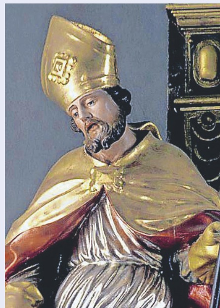
Hl. Valentin, Hörzendorf

Vom hl. Valentin wissen wir nicht allzu viel. Und doch ist uns das Wesentliche überliefert: Dass er diese Hoffnung des Christentums gelebt hat, obwohl der Kaiser dies unterdrücken wollte. Der Priester war gerüstet mit der Kraft des Metaphysischen mit der Kraft Gottes, die alles Böse zu besiegen weiss und die jenem, der ihr vertraut, neue Lebensperspektiven schenkt. Valentin von Rom soll als Priester Liebespaare trotz des Verbots, christlich getraut haben und deswegen am 14. Februar 269 hingerichtet worden sein. Zudem habe Valentin den frisch verheirateten Paaren Blumen aus seinem Garten geschenkt. Die Ehen, die von ihm geschlossen wurden, haben der Überlieferung nach unter einem guten Stern gestanden. Unser christlicher Glaube versteht den Bund der Ehe als ein heiliges Sakrament, das bereits im Schöpferwillen Gottes seine Wurzeln hat: Er erschuf den Menschen als Mann und Frau zu seinem Abbild. Christus heiligt und schützt die Ehe und sie hat in der Überwindung der antiken Dekadenz als Zelle einer neuen,