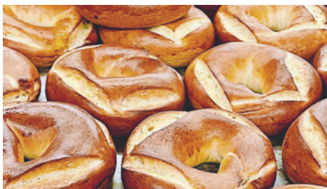
Agatharingli – der Volksglaube sagt, sie sollen vor Feuersbrunst und Heimweh schützen.

Brüste gelten die kleinen runden Brötchen, die am Agathatag von den Kirchgängern zu Hause gebacken werden. Das «Agathabrot» wird im Gottesdienst gesegnet. Auf Wunsch gehen die Seelsorgenden auch in die Bäckereien und segnen in den Tagen zuvor das Mehl für die entsprechenden Backwaren wie Agatharingli oder Agathabrot.