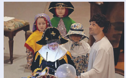
Die Minis in den traditionellen Fasnachtskostümen lesen die Fürbitten.

Es ist dies wiederum im fasnächtlichen Treiben eine Möglichkeit, etwas inne zu halten und Gott für das wunderbare Leben zu danken. Auch für diese «fünfte Jahreszeit», die der Fastenzeit vorgelagert ist und uns erlaubt, in anderer Sichtweise die Welt darzustellen oder zum Beispiel etwas freier zu reden. Wir laden alle zu diesem besonderen Gottesdienst ein.