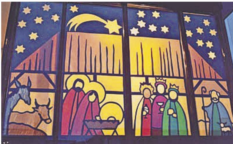
Weihnachtsimpressionen aus Schwyz-Ibach-Seewen