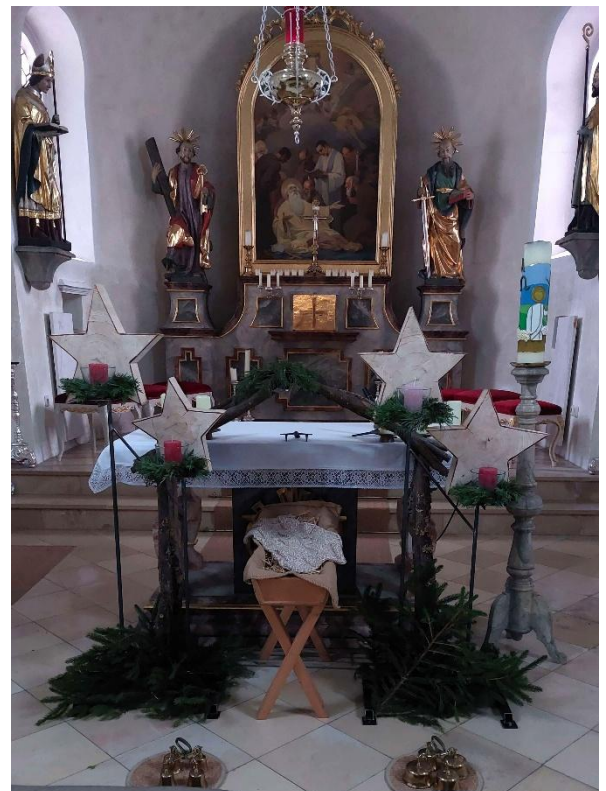
St. Martin Oberpfaundorf