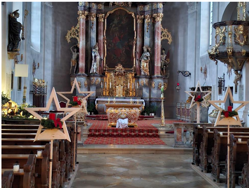
St. Peter und Paul Beratzhausen

Vielen Dank, dass Sie Teil dieses Himmels sind.