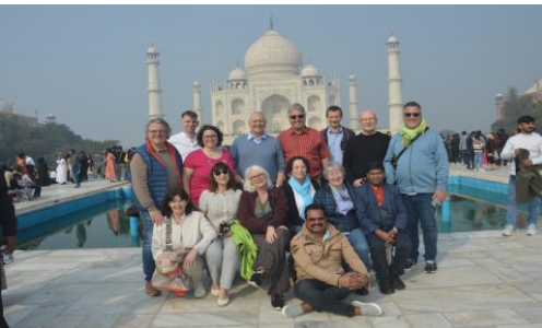
Taj Mahal mit Mausoleum