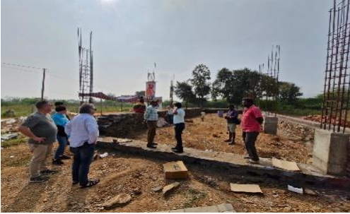
Kirchenbau Kaplan Ravi