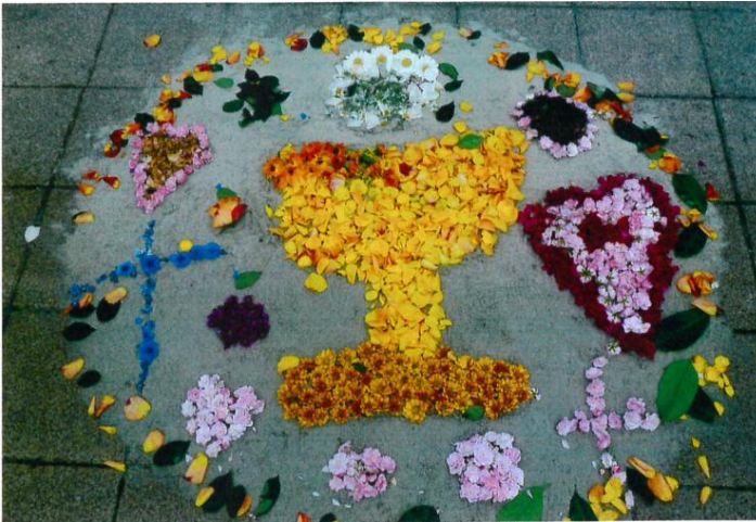
Bild: Blumenteppich an der KiTa St.Bartholomäus