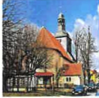
Breitenholz Mariä Heimsuchung