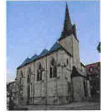
Birkungen St. Johannes d. Täufer