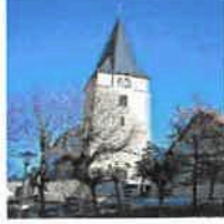
Breitenbach St. Margaretha