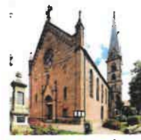
Wingerode St. Johannes d. Täufer