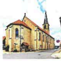
Beuren St. Pankratius