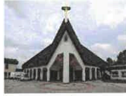
Leinefelde/Südstadt St. Bonifatius