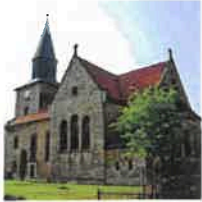
Kallmerode St. Martin