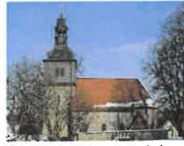
Lfd. St. Maria Magdalena Alte Kirche