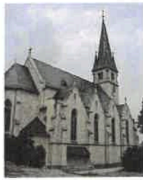
Lfd. St. Maria Magdalena Pfarrkirche