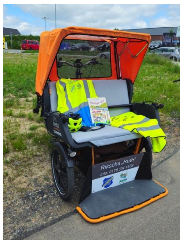
Bild: Diese Rikascha der Marke vanRaam, wie sie auch bei der Hagener Gruppe im Einsatz ist, wollen wir anschaffen. Sie bietet 2 Gästen ausreichend Platz, fährt sich sicher und ist dennoch wendig. Ein E-Antrieb ist selbstverständlich.

Als nächstes wird die Rikscha-Gruppe formal einen Standort von „Radeln ohne Alter“ in Ostercappeln gründen und natürlich die Rikscha kaufen. So sind wir zuversichtlich, dass wir das Ergebnis der Bemühungen auf der Kirmes im September vorstellen und auch segnen können. Schon jetzt ein riesengroßes Dankeschön allen Spenderinnen und Spendern, Unterstützern und allen, die an das Projekt glauben und zukünftig auch als Fahrer:in aktiv werden wollen!