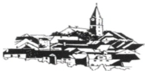
St. Nikolaus Bärnau