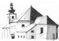
St. Bartholomäus Hohenthau