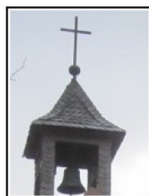
Vöhl, St. Antonius u. St. Elisabeth