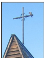
Gemünden (Wohra), St. Anna