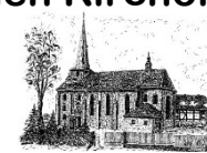
St. Laurentius Gieboldehausen