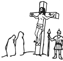
Karfreitag: Das Leben hinzeben.

14.00 Uhr Die Feier vom Leiden und Sterben Christi in Hohenwarth (Wortgottesdienst - Kreuzverehrung - Kommunionfeier)