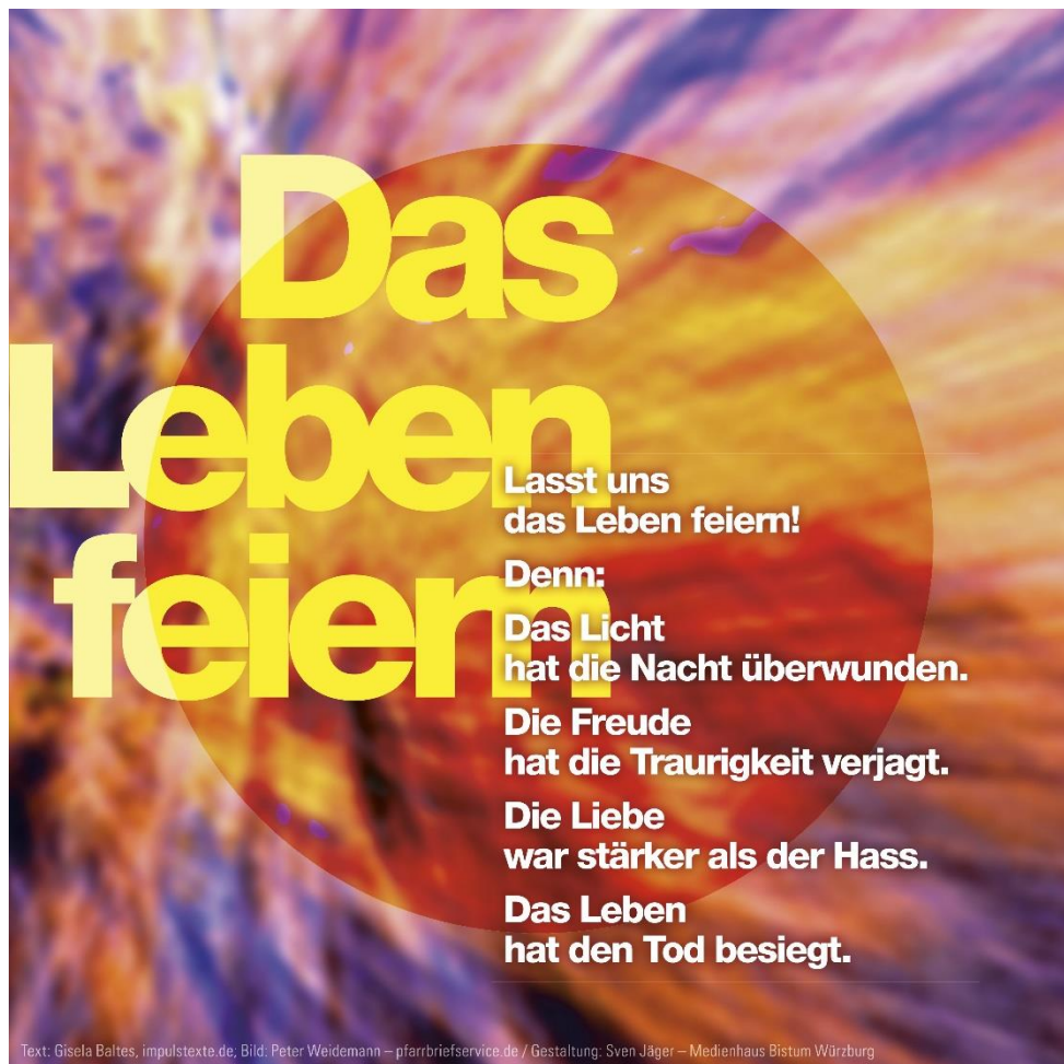
Bild: Peter Weidemann (Foto), Gisela Balthes, impulstexte.de (Text), Sven Jäger (Layout) In: Pfarrbriefservice.de