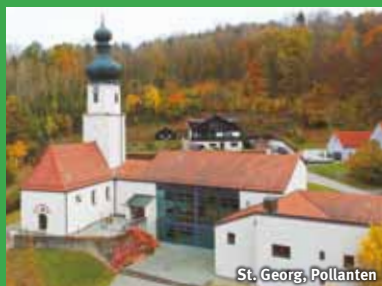
St. Georg, Pollanten