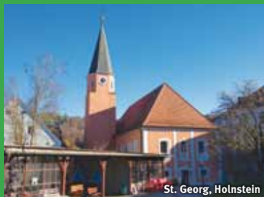
St. Georg, Holnstein