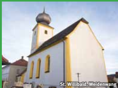
St. Willibald, Weidenwang