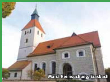
Mariä Heimsuchung, Erasbach