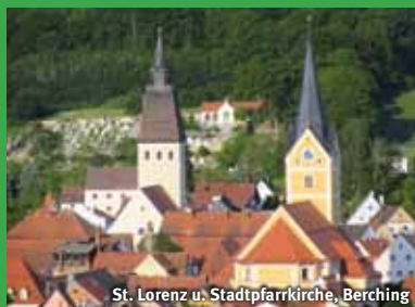
St. Lorenz u. Stadtpfarrkirche, Berching