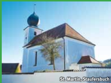
St. Martin, Staufersbuch