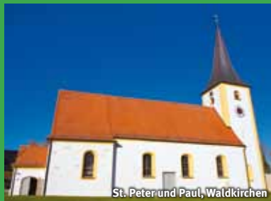
St. Peter und Paul, Waldkirchen