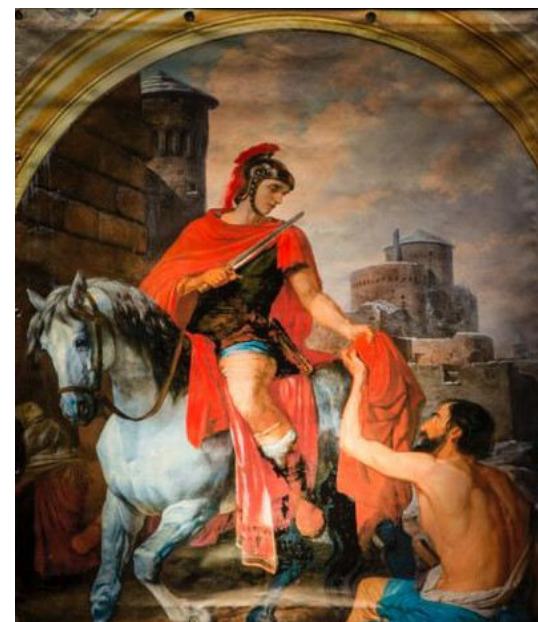
Heiliger Martin von Tours

PFARRBRIEF Niederdorf / Schmieden - St. Veit in Prags BOLLETTINO PARROCCHIALE Villabassa / Ferrara - S. Vito in Braies vom/dal 10.11.2025 bis zum/fino al 23.11.2025 Nr./n. 24