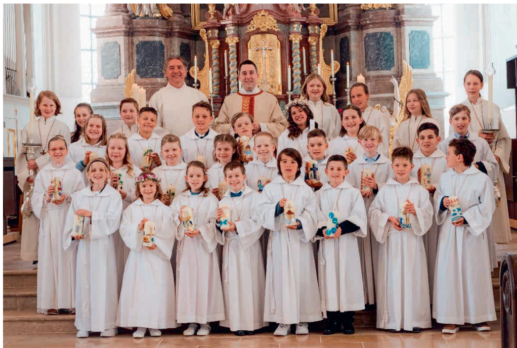
Erstkommunion St. Oswald mit Hl. Kreuz am 10.05.2026