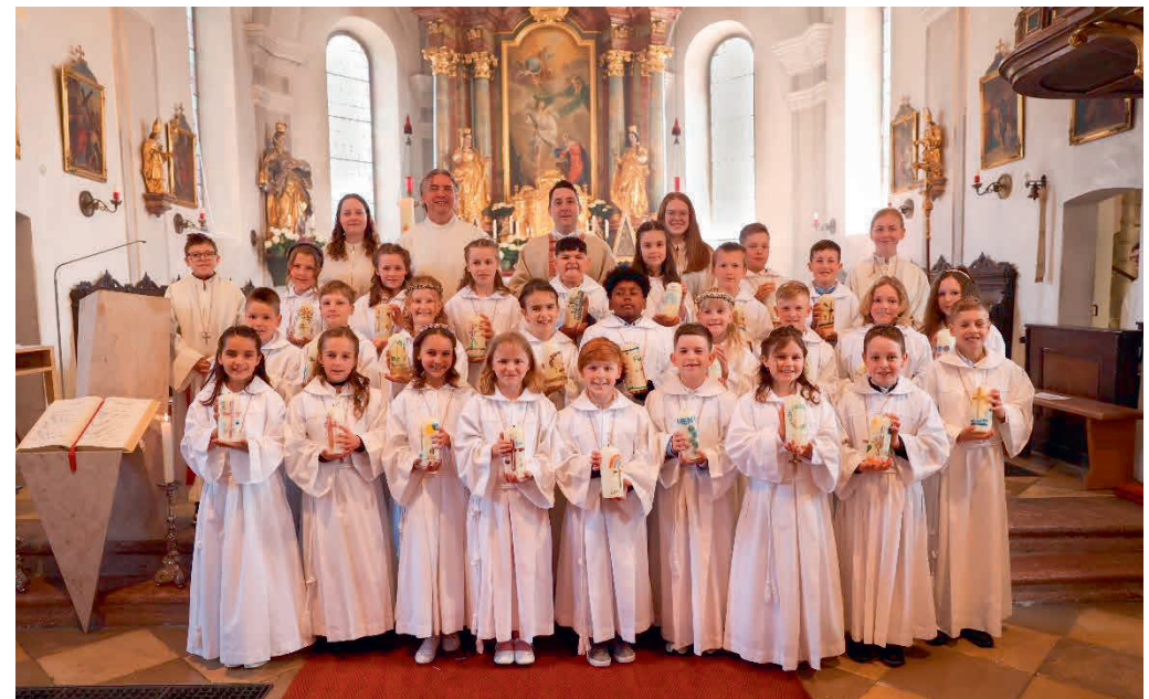
Erstkommunion Haslach am 17.05.2026