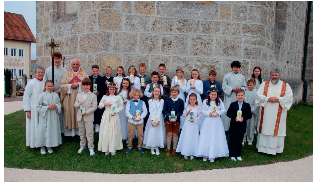
Erstkommunion Kammer am 14.05.2026