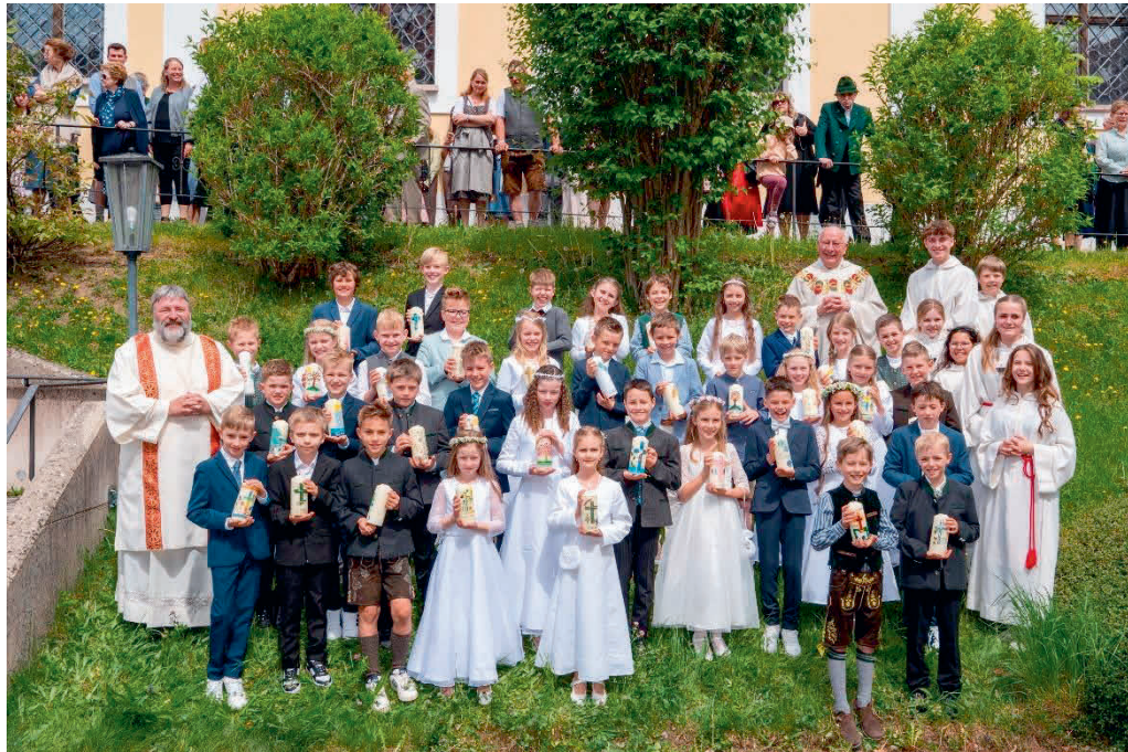
Erstkommunion Surberg am 10.05.2026