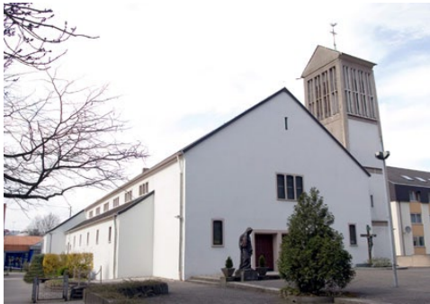
St. Theresia Schafbrücke/Bischmisheim