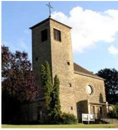
Hl. Familie, Rentrish