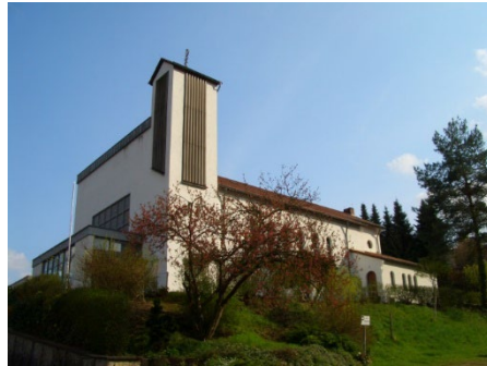
St. Ursula, Scheidt