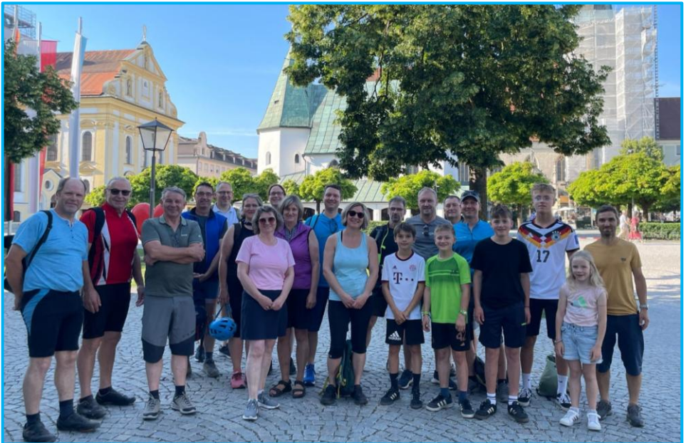
Die Radlergruppe aus Staudach