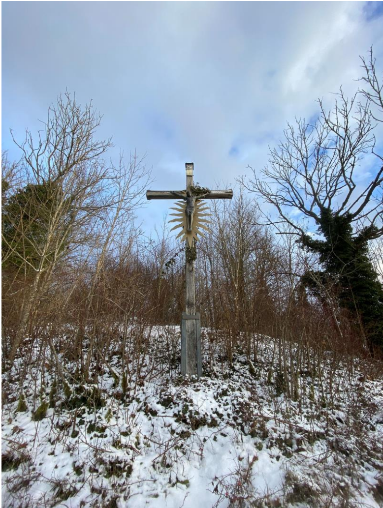
Wegkreuz in Eichstätt