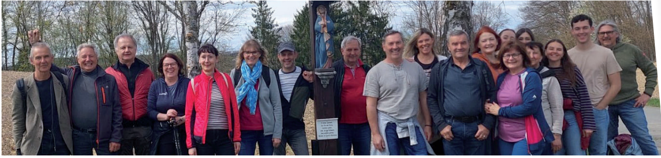
» Dietersdorfer, die am Karsamstag zu Fuß zur Betstunde nach Straden gegangen sind