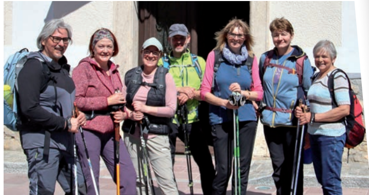
» Zu sehen: die Wallfahrer, die bei der jährlichen Wallfahrt der Dietersdorfer nach Maria Schnee zu Fuß gegangen sind