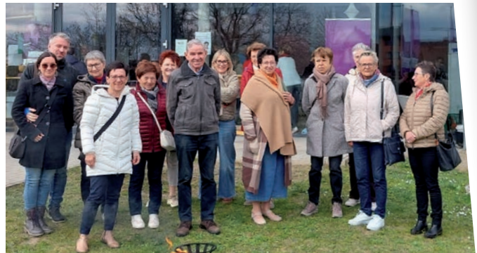
» Passionsspiele - Das Größte aber ist die Liebe 15 Pfarrbewohner aus Straden, Tieschen und Dietersdorf konnten am Palmsonntag diese Botschaft unseres Glaubens auf besondere Weise spüren. Die Passionsspiele in Feldkirchen bei Graz ließen uns erleben, dass diese bedingungslose Liebe Jesu auch jenen gilt, die ihn verraten und verurteilen. Als Einstimmung auf die Osterwoche haben wir diese hervorragende Aufführung gemeinsam erleben dürfen. Gudrun Gangl