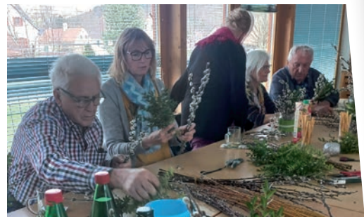
» Palmbuschenbinden der Senioren