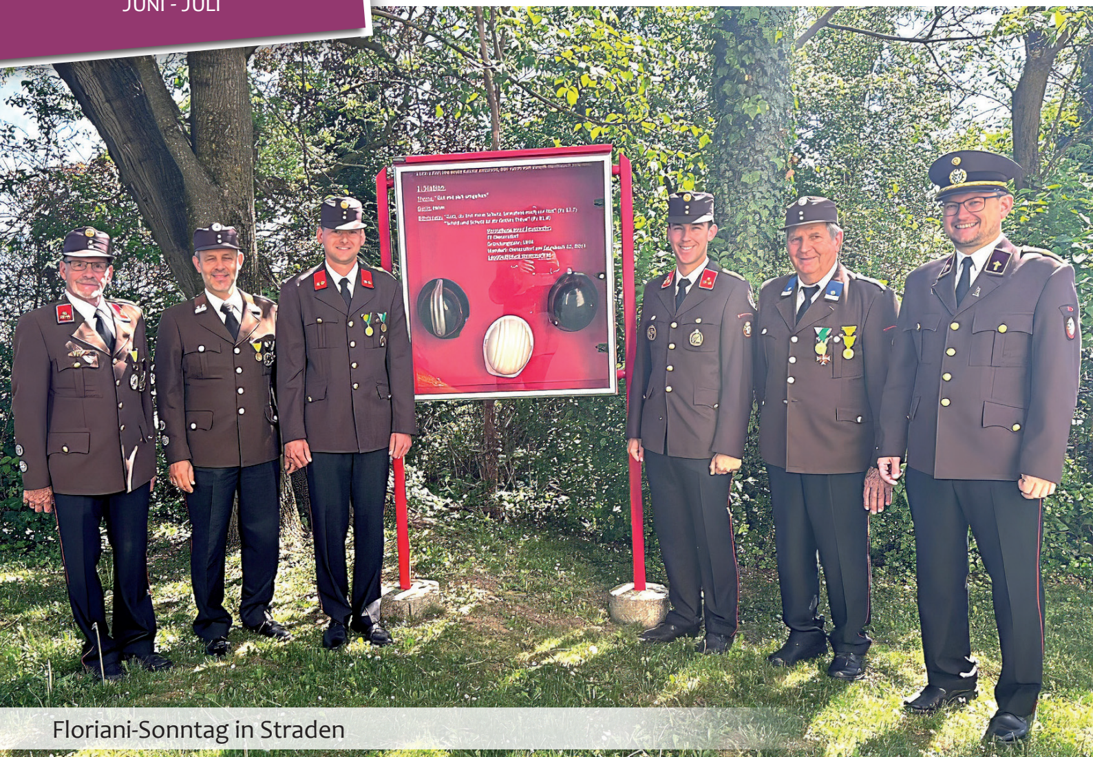
Floriani-Sonntag in Straden

MITEINANDER IN STRADEN DIETERSDORF UND TIESCHEN