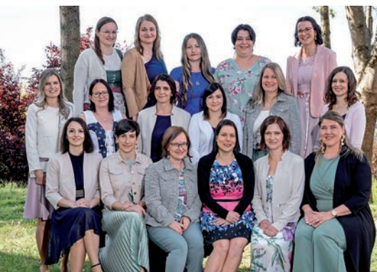
» Tischmütter in Straden