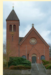
St. Johannes Bapt.