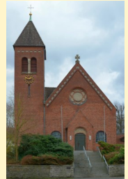
St. Johannes Bapt.