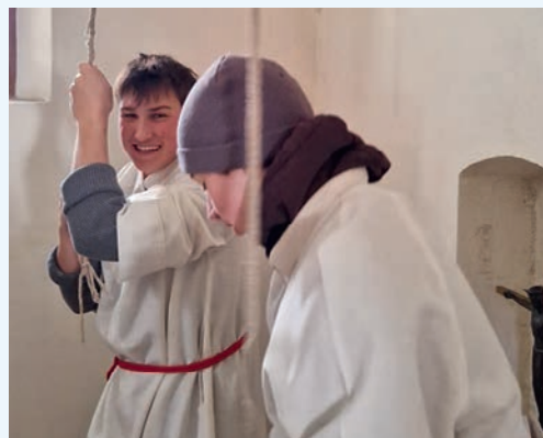
Unter Sturmgeläut wurden die Gläubigen zum Gebet gerufen.