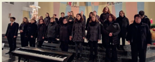
Mitglieder des Kirchenchors Mainburg