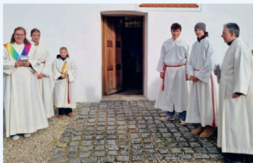
Beim Einzug in Marzell.