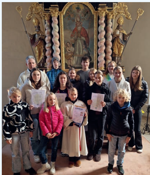
Bei der Verabschiedung.