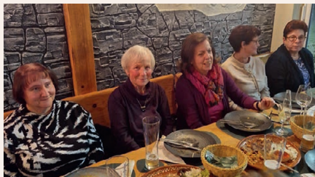
Unsere fleißigen Sängerinnen und Sänger