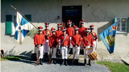
Cumpignia da mats, Sagogn

der Mitchristen mit der Kirche kann keine Gemeinschaft überleben. Andererseits müssen die jungen Generationen oder Menschen mit guten Ideen mutig sein und sich bereit erklären, solche Posten für die Entwicklung der Kirche zu übernehmen.