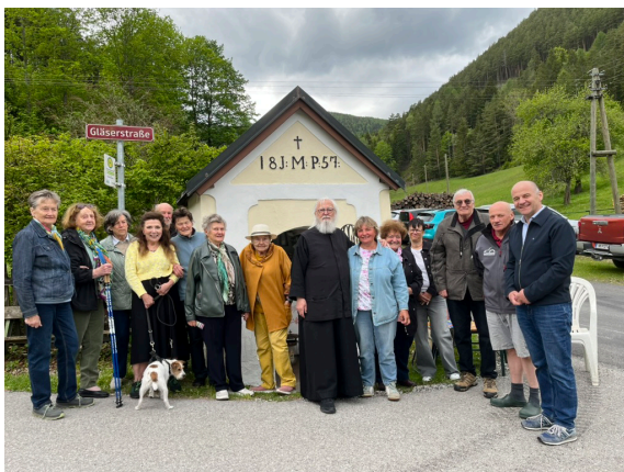
Maiandacht Adlitzgraben am 20. Mai 2026