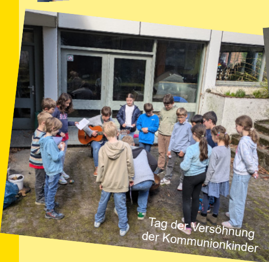
Tag der Versöhnung der Kommunionkinder