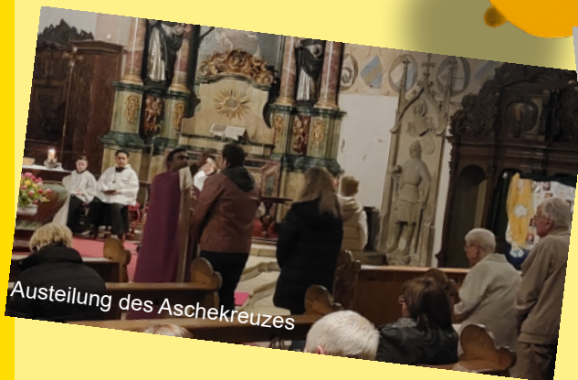
Austeilung des Aschekreuzes