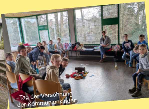
Tag der Versöhnung der Kommunionkinder