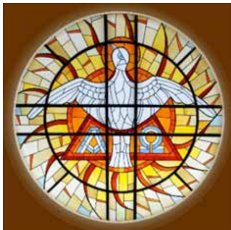
Bild: Foto: Martin Manigatterer Kunst: Glaswerkstätten im Stift Schlierbach Standort: Fatimakapelle Schardenberg In: Pfarrbriefservice.de