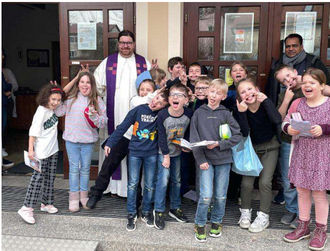
Quatschfoto zum Versöhnungsfest nach der Erstbeichte in Kirchenthumbach

Sylvio Krüger In: Pfarrbriefservice.de ; Fotos Erstkommunionkinder von Erstkommunioneltern