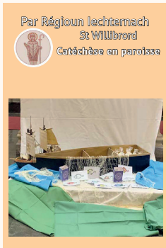
Par Régioun Iechternach St Willibrord Catéchèse en paroisse

Am Joer vun der Kommunioun gëtt et niewt der Kateches eng speziell Virbereedung op d'Fest vun der éischer Hl. Kommunioun: d'Kanner huelen regelméisseg un de Gottesdengschter deel an u speziellen Aktivitéiten respektiv Prouwen.