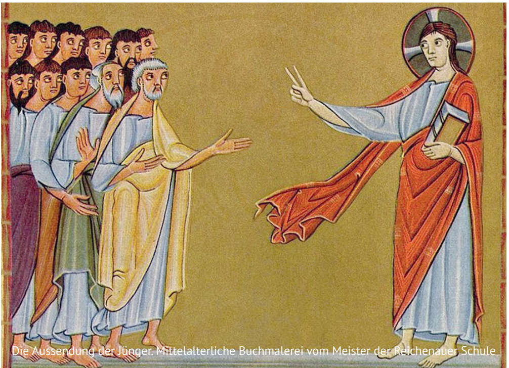
Die Aussendung der Jünger. Mittelalterliche Buchmalerei vom Meister der Reichenauer Schule

In jener Zeit rief Jesus die Zwölf zu sich und sandte sie aus, jeweils zwei zusammen.