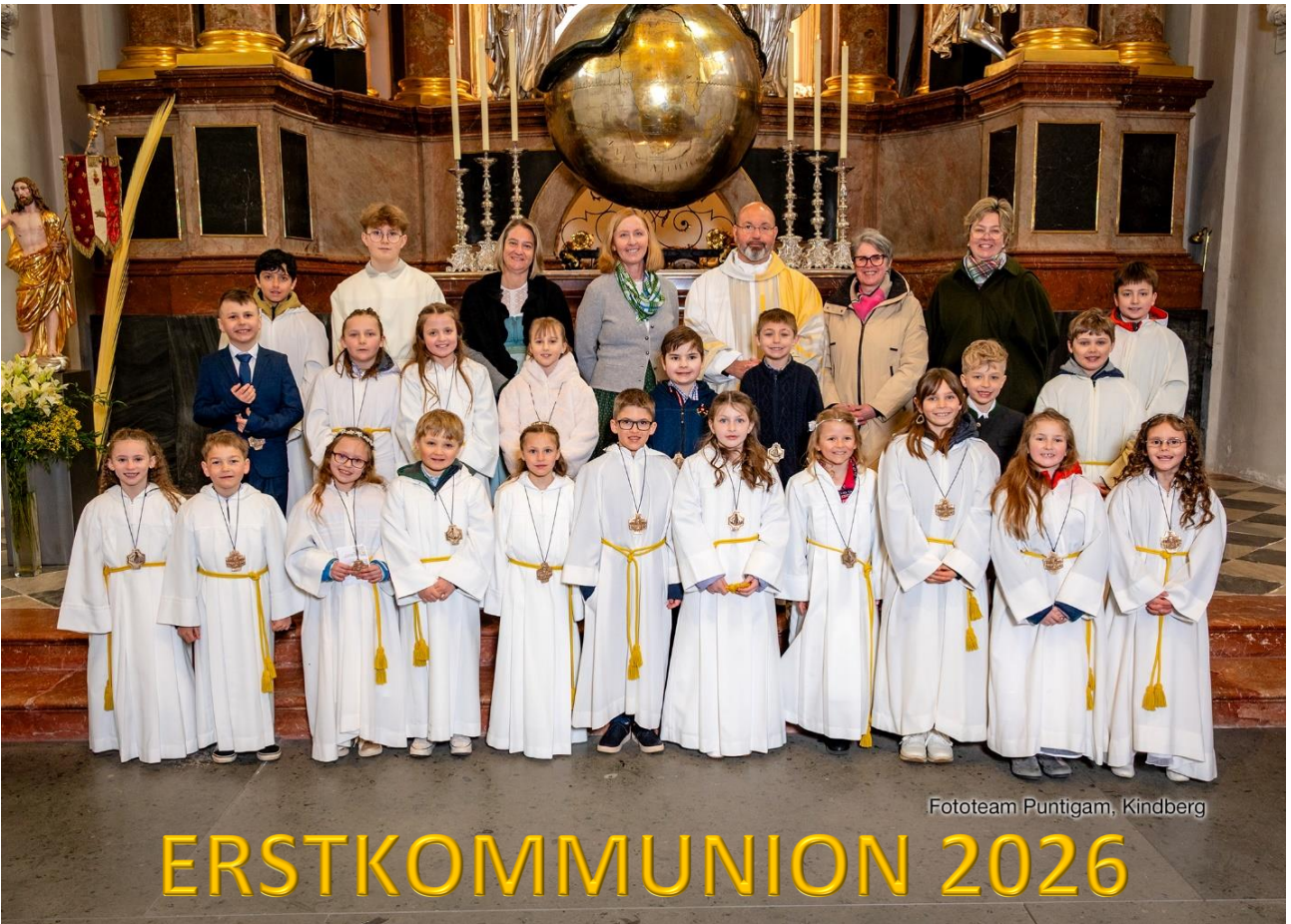
Fototeam Puntigam, Kindberg