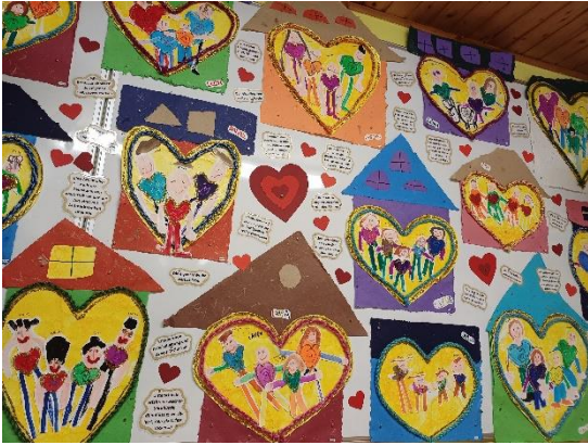
Jedes Kind gestaltete sein Familienhaus ...

So standen auch unsere MUTTERTAGSFEIER im Kindergarten , sowie die MUTTERTAGSMESSE ganz im Zeichen des HAUSES, das einen HERZENSPLATZ widerspiegelt.