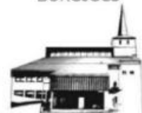
HERZ JESU PFAFFENHAUSEN