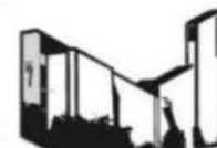
KOSTBARES BLUT BURGJOSS