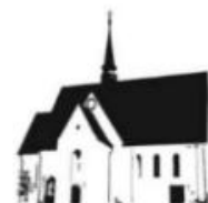
ST. PETER MERNES

Mühlbachweg 3 63628 Bad Soden-Salmünster - Mernes ☎ 06660 / 91 94 20 E-Mail: sankt-peter-mernes@pfarrei.bistum-fulda.de