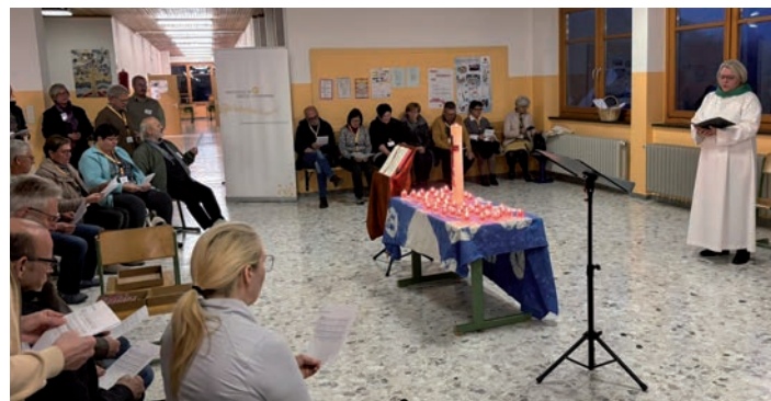
» Gemeinsame Wort-Gottes-Feier

Unter dem Motto „Viele Dienste - ein Geist“