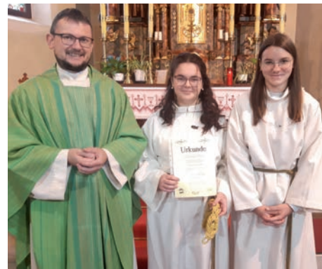
» Minis aus Tieschen