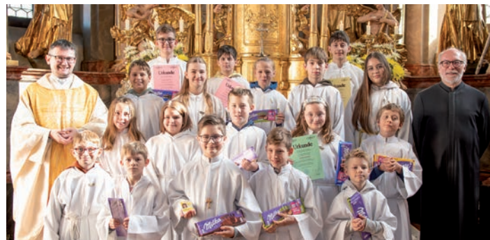
» Minis aus Straden