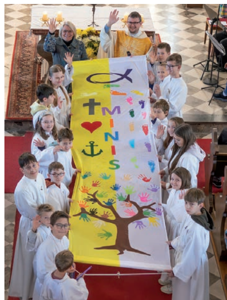
» Minis mit ihrer selbst gestalteten Fahne