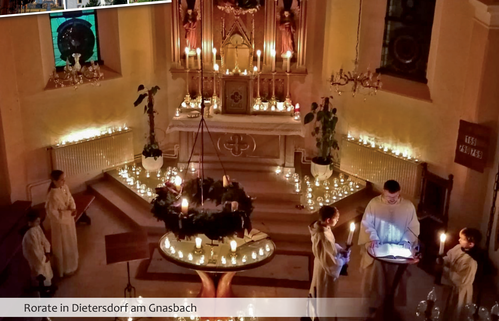
Rorate in Dietersdorf am Gnasbach