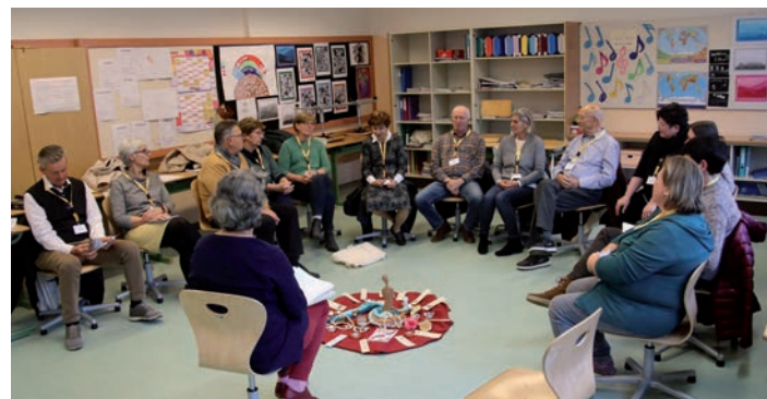
» Workshop für Vorbeter

und zeigten damit, wie lebendig das Engagement der vielen Ehrenamtlichen ist, die in den verschiedensten liturgischen Bereichen mitwirken. In fünf verschiedenen Workshops konnten sich die Teilnehmenden zu ihren jeweiligen Aufgaben – von der Wortgottesfeierleitung über den Lektorendienst und den