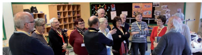
» Workshop für Mesner und Kirchenschmücker