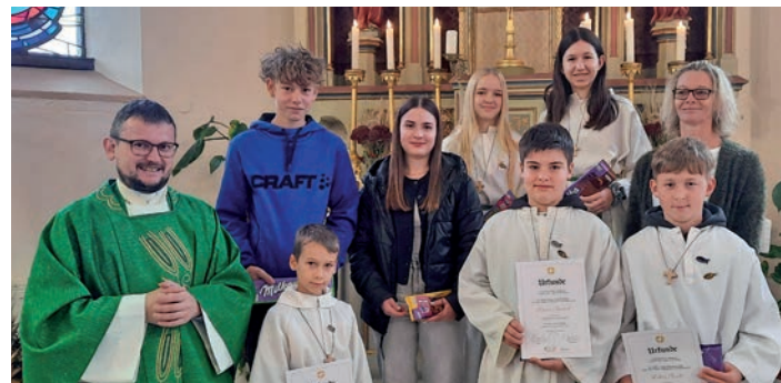
» Minis aus Dietersdorf