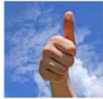
Daumen Hoch FAMILIENKIRCHE IN EILENDORF

Gemeinsam fröhlich Gott loben und sich von seiner Botschaft stärken lassen.