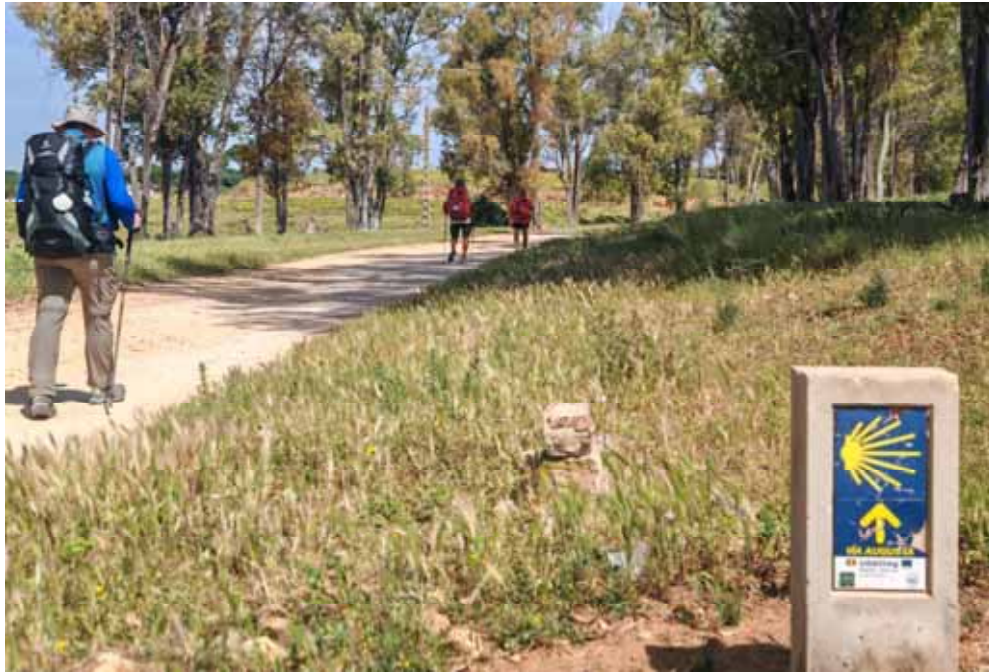
Unterwegs auf der Via Augusta