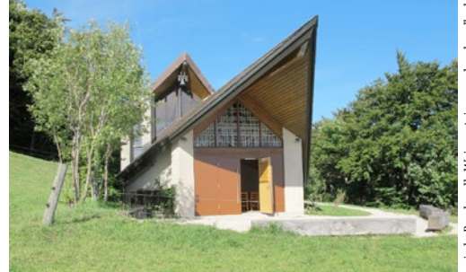
Stiftung Ökumenische Bergkapelle Weissenstein, www.bergkapelle.ch