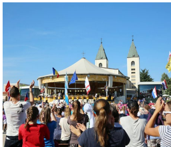
Bilder: Medjugorje Jugendfestival in Bosnien-Herzegowina

Der Glaube spielt eine bedeutende Rolle in meinem Leben. Er gibt mir Halt und ermöglicht es mir, Situationen aus einer breiteren Perspektive zu betrachten. Schon früh war der Glaube ein fester Bestandteil meines Lebens, da ich mit meiner Familie regelmässig die Kirche besuchte und meine Eltern vor dem Schlafengehen mit mir beteten. Meine erste persönliche Glaubenserfahrung machte ich mit etwa neun Jahren während einer Pilgerreise nach Bosnien-Herzegowina. Gemeinsam mit Verwandten und Bekannten fuhren wir mit dem Car von Matzendorf nach Medjugorje zum Jugendfestival, wo jeden Sommer Zehntausende junger Menschen aus vielen Ländern zusammenkommen, um ihre Freude am Glauben zu teilen. Ich fand es faszinierend, so viele Gläubige aus aller Welt an einem Ort zu sehen. Die Messe fand draussen statt, und selbst inmitten der Menschenmenge konnte ich Momente der absoluten Stille erleben. An diesem Ort empfand ich einen tiefen Frieden und eine Freude, die ich bis dahin noch nicht kannte. Seitdem habe ich das Jugendfestival mehrmals besucht und hoffe, bald wieder dorthin gehen zu können. In meinem Leben gibt es immer wieder Zeiten, in denen mein Glaube mal stärker und mal schwächer ist. Doch ich bin überzeugt, dass egal wie weit wir uns manchmal von Gott entfernen, er immer nahe bei uns ist und uns auf unserem Weg begleitet.