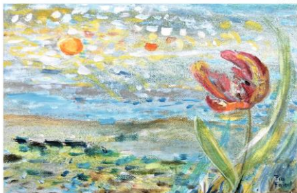
Ein Tag ohne Gebet ist wie ein Himmel ohne Sonne, wie ein Garten ohne Blumen.