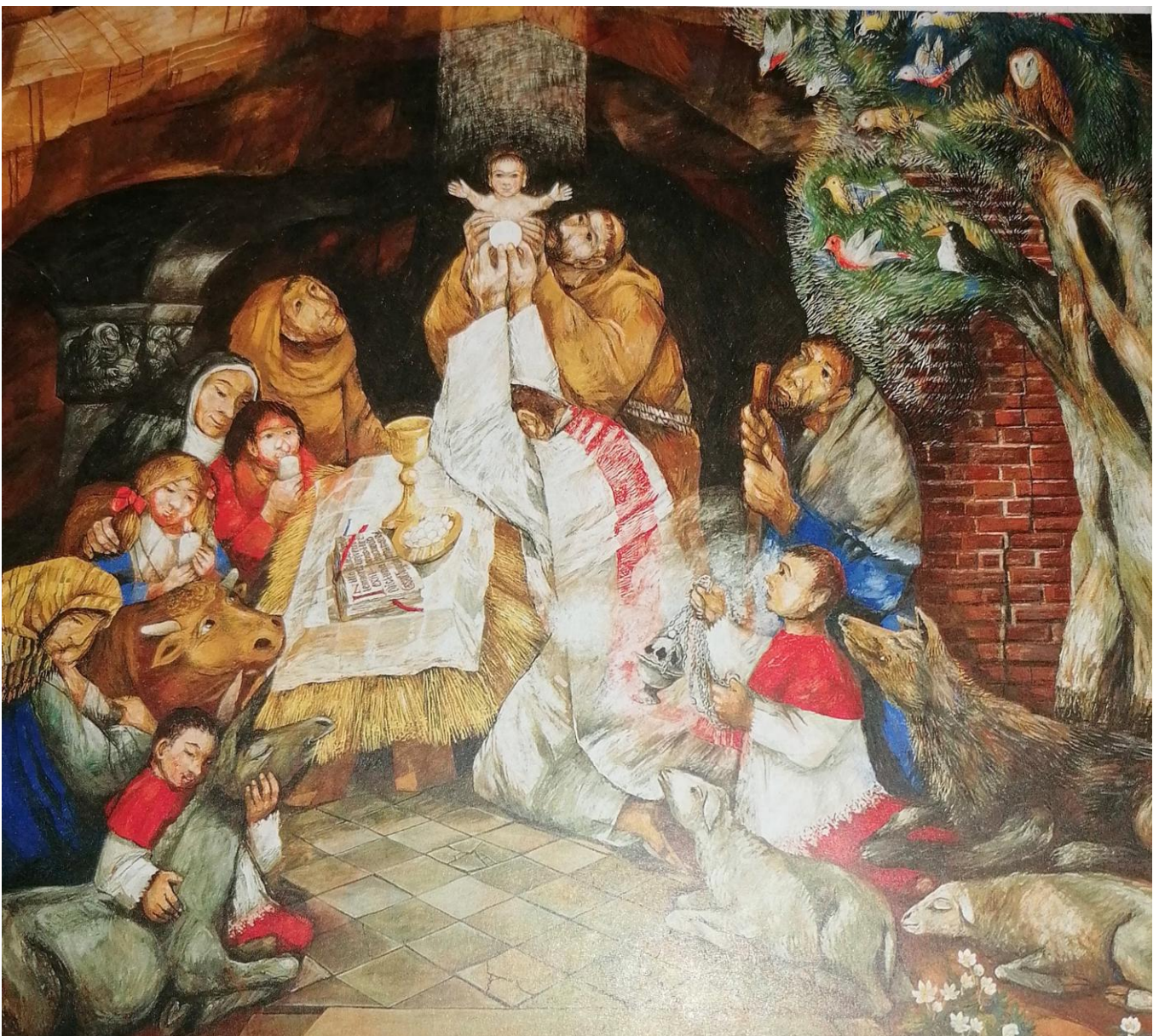
Greccio Fresco in Ellwangen, Maler: Sieger Köder

Weihnachtspfarrbrief für 4 Wochen vom 14.12.2025 – 11.01.2026