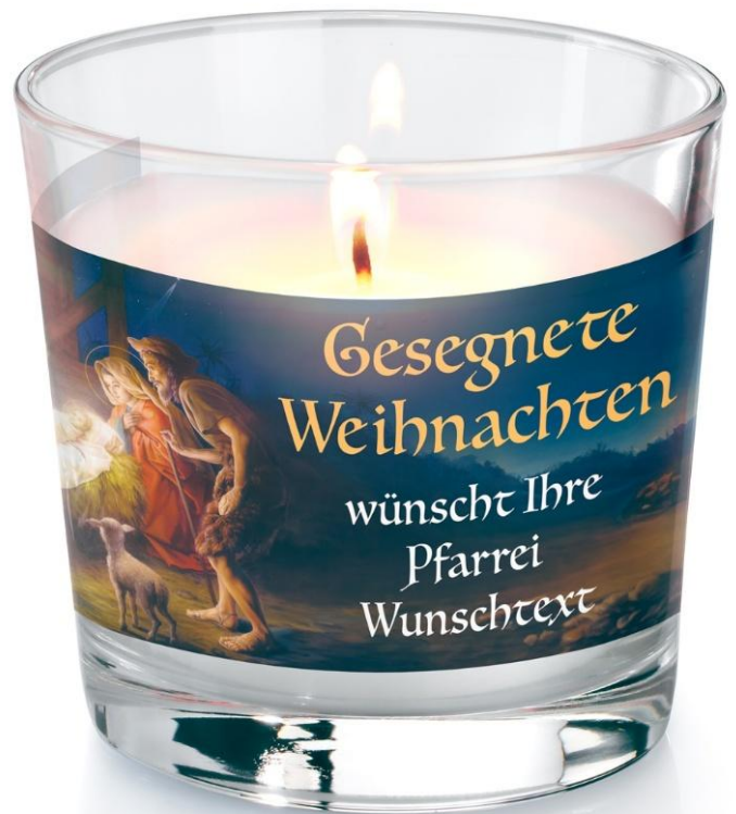
Großes Glas- Windlicht Preis/Stück: 3.50 €