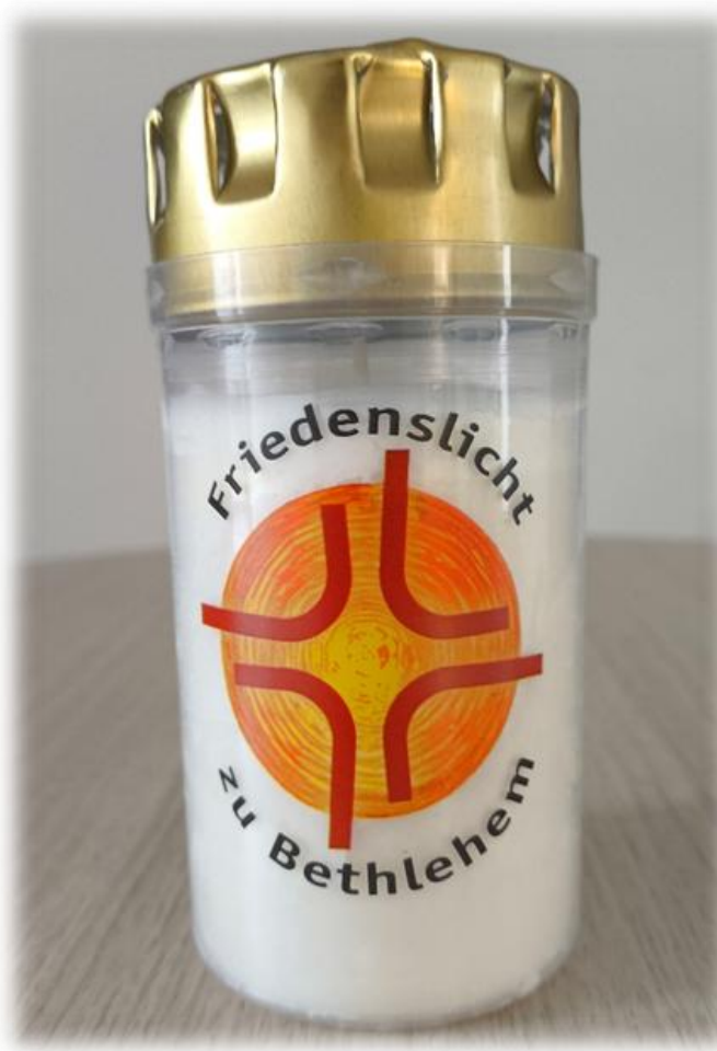
Friedenslicht Preis/Stück: 2 Euro

Ab dem 3. Advent ist steht das Friedenslicht aus Bethlehem zur An- und Mitnahme in den Kirchen bereit.