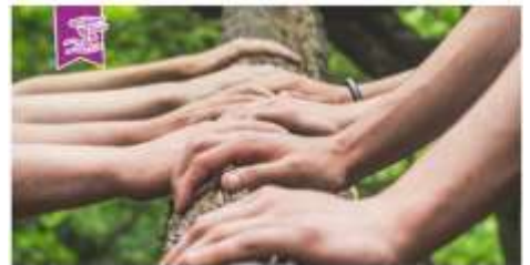
Woche 4 Gemeinsam. Leben.