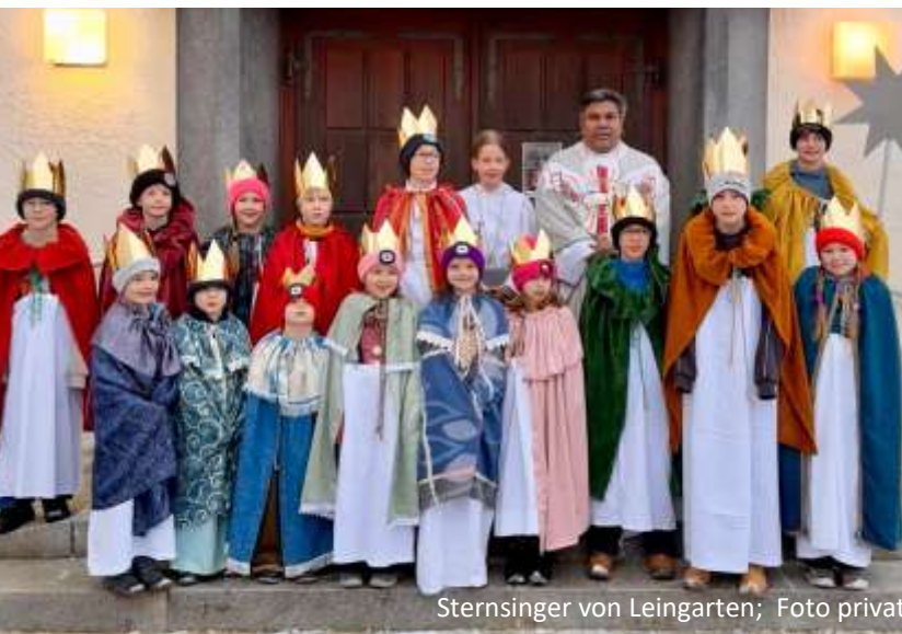
Sternsinger von Leingarten