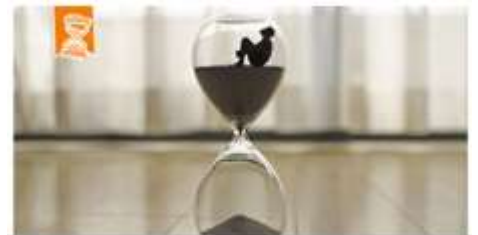
Woche 5 Geschenkt. Zeit.