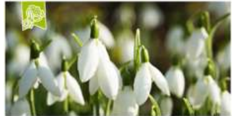
Woche 1 Genug. Beschenkt.